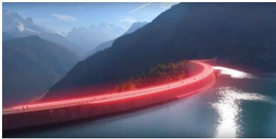
Spot by: Monte Nero Productions